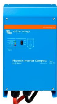
Inverter Compact 24/1600

Les possibilités des convertisseurs puissants en parallèle sont réellement surprenantes. Pour en savoir plus sur les batteries, les configurations possibles et des exemples de systèmes complets, veuillez consulter notre livre « Energie Sans Limites » (disponible gratuitement chez Victron Energy et en téléchargement sur http://www.victronenergy.fr ).